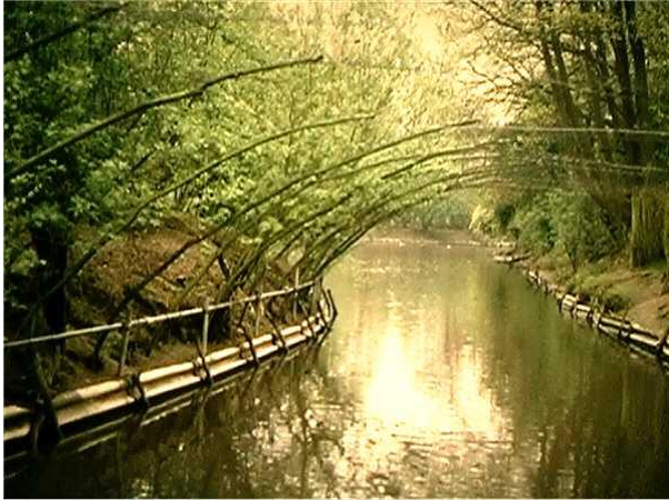
Een voorbeeld van een vangpijp.