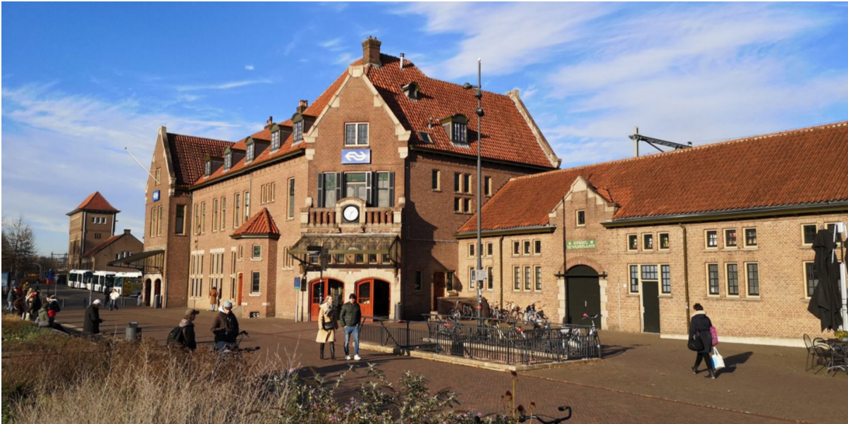
Het stationsgebouw anno 2024