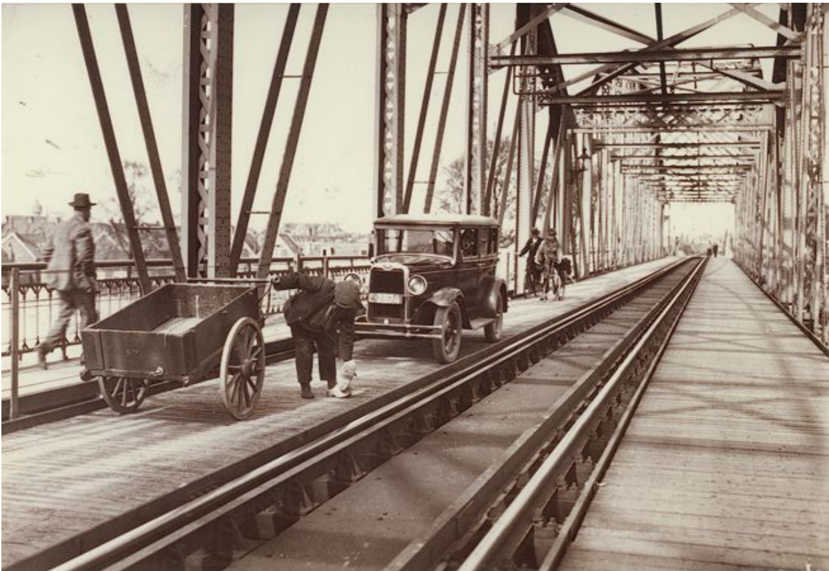
De oude spoorbrug

De eerste spoorbrug over de IJssel is geopend op 21-11-1887. Het was een enkelspoor met een voetpad van 1,25 meter ernaast. Daarover werd geklaagd, omdat dat voor twee gezette heren te smal was om elkaar te passeren. Toch heeft men het daar heel lang mee moeten doen.