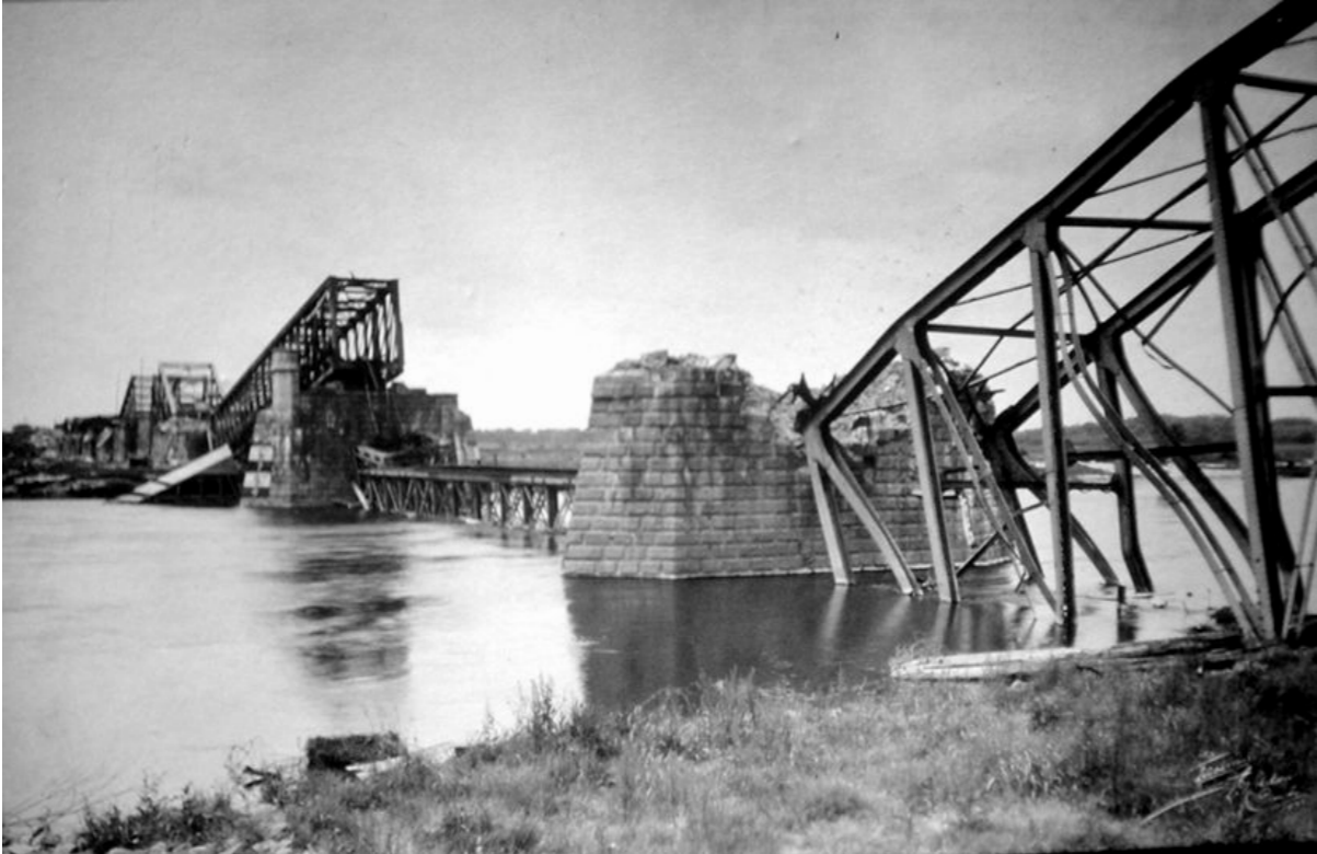
De opgeblazen brug

In het najaar 1944 en het voorjaar 1945 hebben geallieerde bommenwerpers vele keren geprobeerd om de brug te bombarderen. Er zijn in totaal ongeveer 1000 bommen afgeworpen. Geen van de bommen heeft de brug geraakt. Wel kwamen meerdere bommen in de stad terecht en veroorzaakten daar veel leed en schade. Uiteindelijk is de brug op 10 mei 1945 toch opgeblazen, maar nu door de Duitsers om de opmars van de Canadezen tegen te houden of te vertragen.