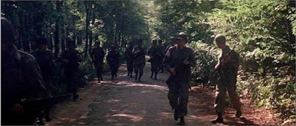
Enkele acteurs die de rol van Amerikaanse soldaat spelen.