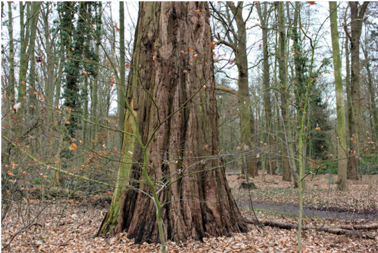
De sequoia gigantea