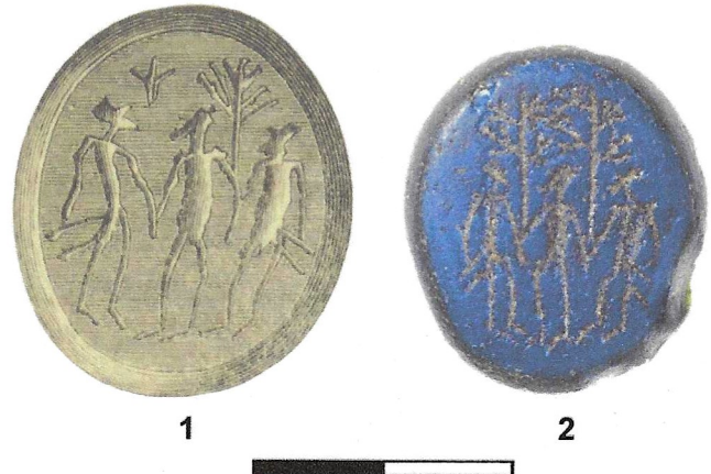
Fig. 5. De Alsengemmen van Suddens (nr. 1) en Alby (nr. 2). Foto Kalmar läns Museum, Pierre Rosberg (nr. 2). Tekening uit Von Alten 1882 (nr. 1).