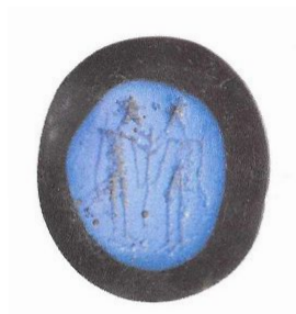
De alsegem van Britsum met afmeting 26 x 23 mm

Een alsegemme is een kleine ronde of ovalen glazen amulet uit de middeleeuwen. Het is meestal zo groot als een één euromunt. De naam verwijst naar het Deense eiland Als waar in 1871 een alsegemme werd gevonden. Meerdere alsegemmen zijn in Friese terpen gevonden. De alsegemme van Britsum werd in 1905 bij een afgraving van een terp bij het Friese plaatsje Britsum gevonden door de toen 12 of 13 jarige Klaasje van der Weit, de grootmoeder van de heer P. Dijkstra uit Epse. De familie Dijkstra heeft er prima op gepast.