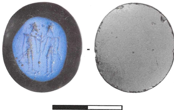
Fig. 4 De Alsengem van Britsum.