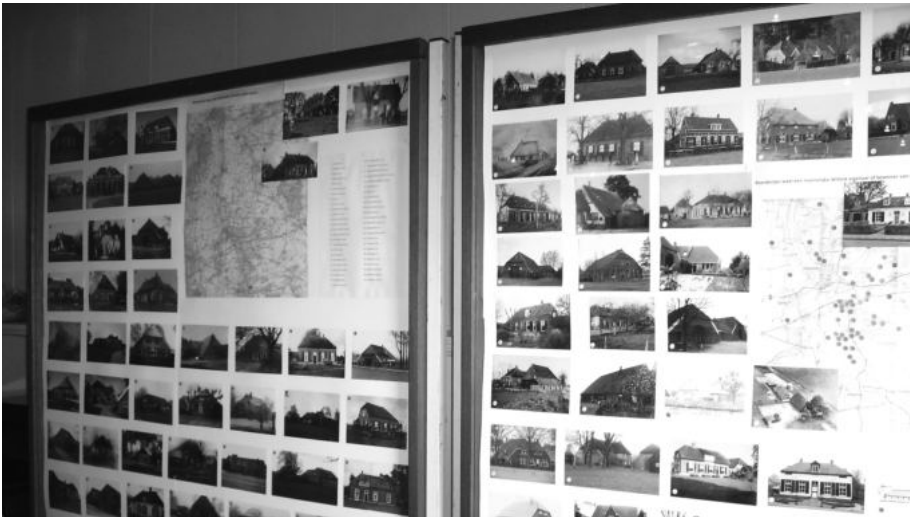
De fotogalerie van de Wiltinkboerderijen