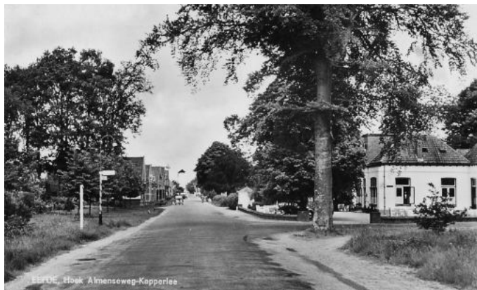
Kapperallee, kruising bij De Uitrusting