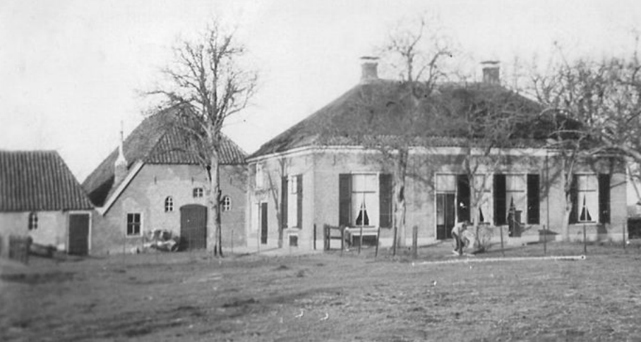
Erve 't Hekkert in Epse