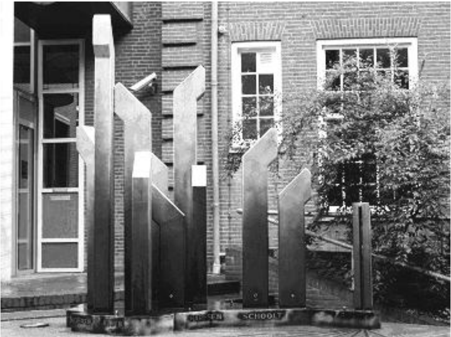
Zonnewijzer De Elf Marken bij de ingang van het voormalig gemeentehuis