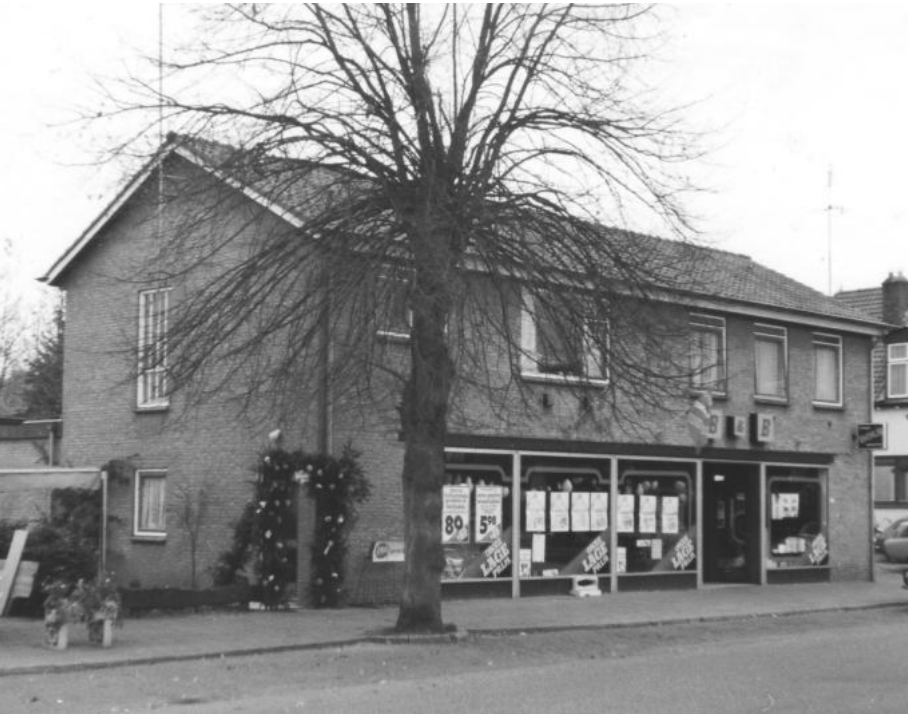
De opening van de zelfbedieningswinkel B & B in 1970

De heer Bouwmeester werd bedrijfsleider en heeft het bedrijf nog een paar jaar voortgezet en daarna werd het bedrijf verkocht aan de familie Bechtle.