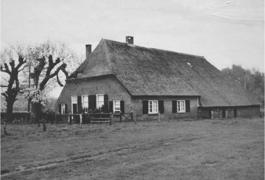
De foto van de boerderij is gemaakt in 1955, de naam van de fotograaf is niet bekend.