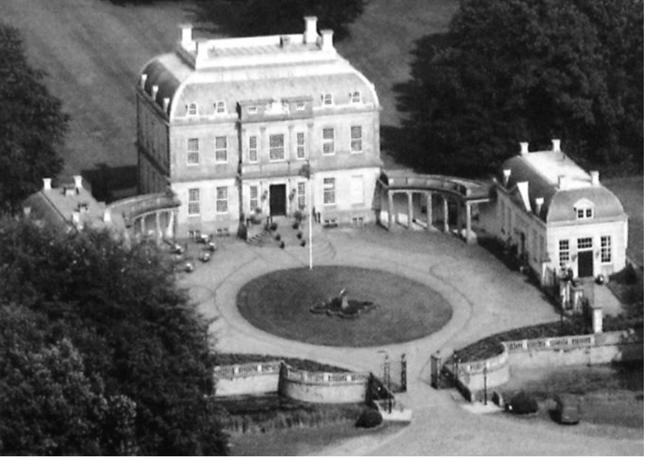
Uit venster 17, Landgoederen