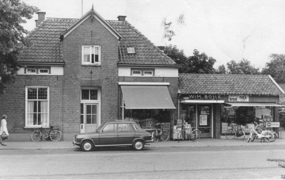
De uitbreiding in 1960