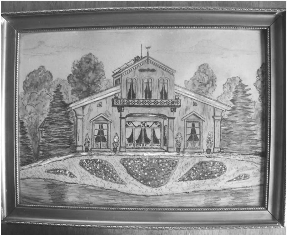
Een schilderij van het herenhuis De Larxenpas

mooie grote tuin ligt aan de overzijde van de weg. Hier kunnen ze de paarden stallen. Aan de achterkant van het huis verheffen zich grauwe zandbulten en vanaf een van die heuvels komt men zo op de tweede verdieping. De heer uit de stad boert hier voor zijn genoegen. Hij houdt er bijen en vreemde hoenderrassen en kweekt er allerlei vruchtbomen. Vaders neef is er zoveel als zetboer. Heuvel schrijft over zijn familie dat het kinderloze lieden zijn. De dikke vrouw is gul en spraakzaam. De baas zelf heeft een air van kennis en geleerdheid, leengoed van zijn patroon, die vader een beetje prikkelt. Maar hij luistert met plezier naar zijn verhalen over het grote Amsterdam, waar hij acht dagen gelogerd heeft op de Herengracht bij zijn meneer”. (Ik ben in het bevolkingsregister ijverig aan het speuren geweest, maar heb het familielid van Heuvel nog niet kunnen vinden.)