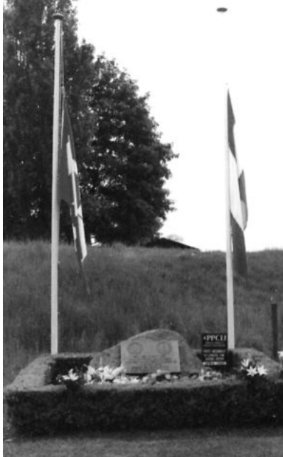
Uit venster 30, Oorlog en bezetting

In 1885 opende de Geldersch Overijsselse Stoomtramweg Maatschappij GOSM de verbinding per stoomtram van Deventer naar Borculo via Epse, Harfsen, Laren, Lochem en Barchem. Pas veel later, in 1926, startte de stoomtram van Deventer naar Zutphen via Epse, Gorssel en Eefde. Alle regionale tramlijnen werden vanaf 1934 geëxploiteerd door één onderneming, de Geldersche Tram-3wegen GTW.