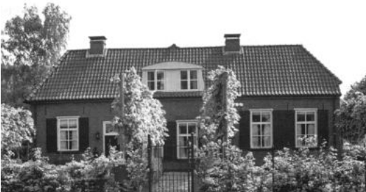
Het Grote Braakman in de huidige staat