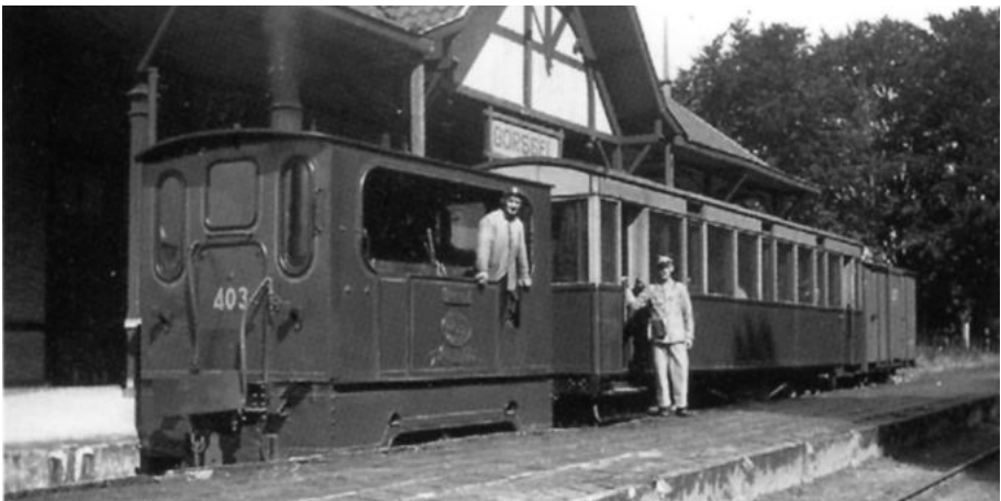
Uit venster 23 Trams, treinen en stations

Tot in de achttiende eeuw was de Spitholderbrug bij Almen de enige plaats waar 's winters het handelsverkeer vanuit Westfalen naar Deventer de Berkel kon passeren. Door deze strategische ligging was er eeuwenlang strijd tussen de hanzesteden Zutphen en Deventer over de passage van deze brug.