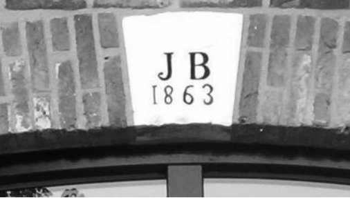
De sluitsteen boven de achterdeuren