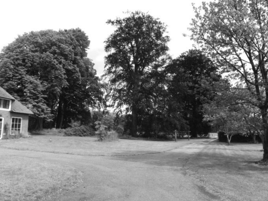
Achter deze rode beuk heeft het herenhuis De Larxenpas gestaan.