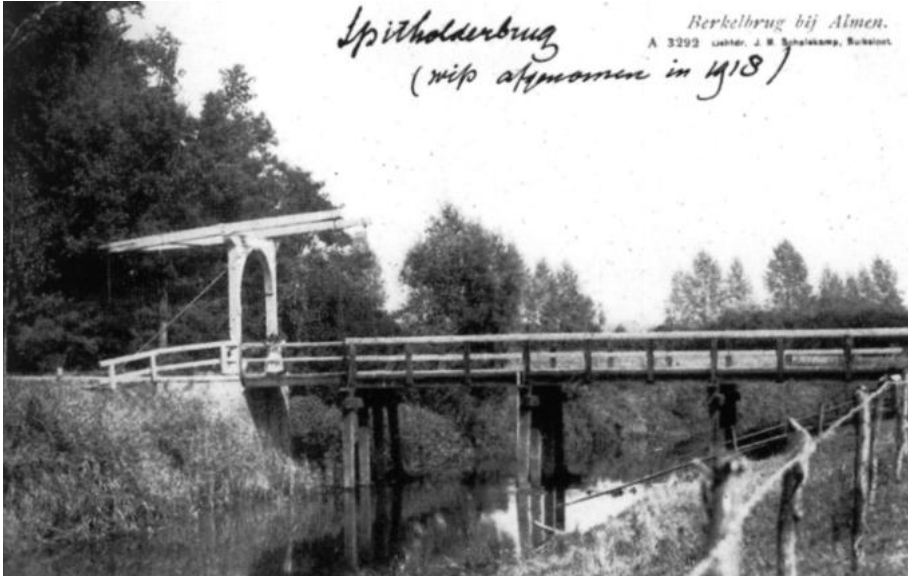
Uit venster 18, Slag bij de Spitholderbrug

Tot in de achttiende eeuw was de Spitholderbrug bij Almen de enige plaats waar 's winters het handelsverkeer vanuit Westfalen naar Deventer de Berkel kon passeren. Door deze strategische ligging was er eeuwenlang strijd tussen de hanzesteden Zutphen en Deventer over de passage van deze brug.