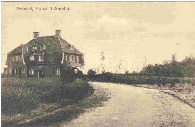
Foto: Huize Amelte, 1925