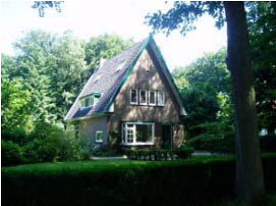
Foto: Joppelaan 43, anno 200