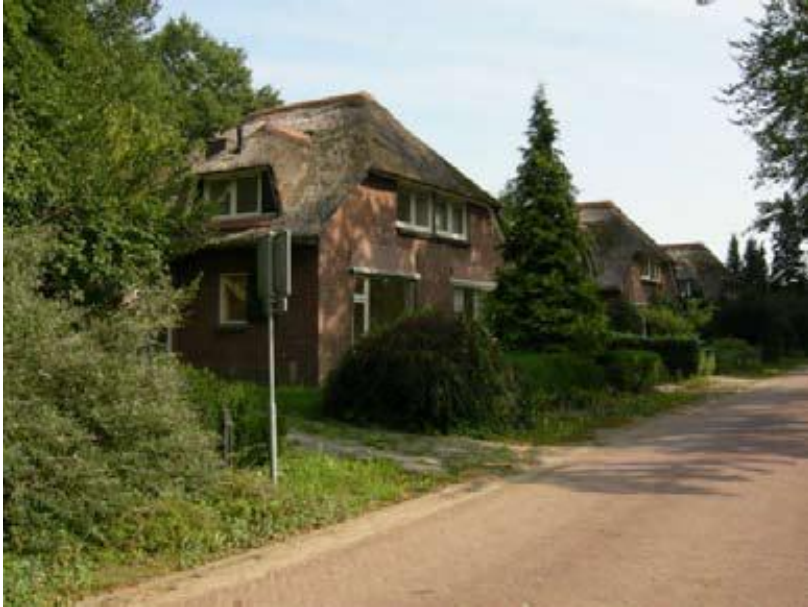
Arbeiderswoningen Gorssel, 1919. Dakvenster in rieten dak

Vanaf de Veldhofstraat terug naar de Hoofdstraat. Einde wandeling.