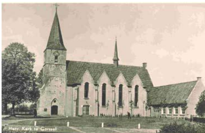
De kerk in 1965 1

Daarboven wordt de opmars van de Duitsers voorgesteld door duivelse figuurtjes, die met helm open met laarzen aan de pilaar beklimmen.