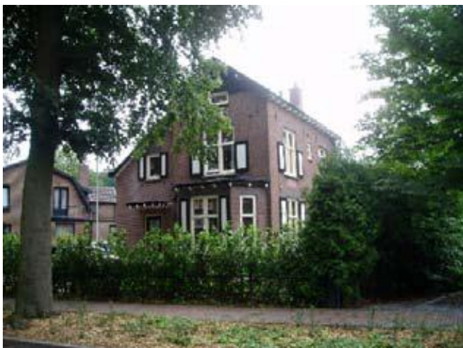
Gebouwd in 1912