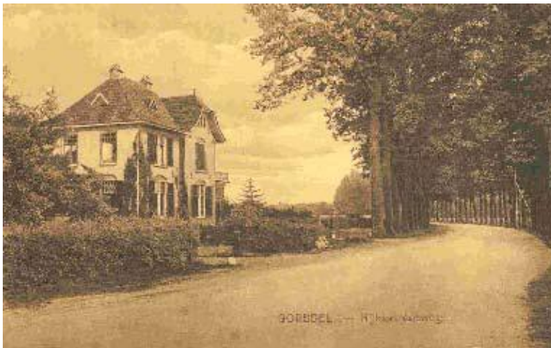
de Zonnekamp in 1928, situatie voor de aanleg van de rondweg

Gebouwd omstreeks 1900 door architect J.D. Gantvoort uit Deventer. Gemeentelijk monument. Vanaf 1975 ongeveer 20 jaar politiebureau. De villa is een goed voorbeeld van de in de eerste jaren van de twintigste eeuw gangbare bouwstijl, die zich kenmerkt door een zorgvuldige detaillering. Het pand is een markant element bij de entree van het dorp Gorssel. Opvallend is het bewaard gebleven ijzeren draaihek, dat is voorzien van bloemdecoraties.