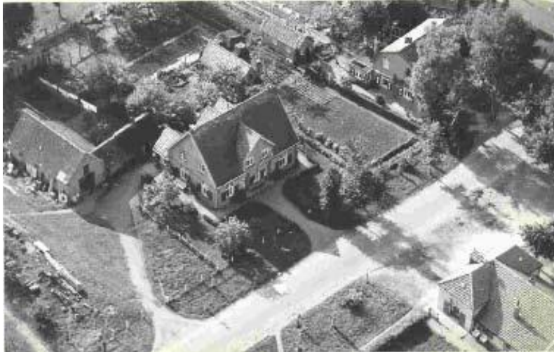
Capellenhof, luchtfoto 1950

Dubbel woonhuis gebouwd in 1929 in plaats van bestaande woning, die bij de markeverdeling in 1837 werd aangeduid als "Kappelleplaats" Architect B.J. Woertman en gebouwd door zijn broer T. Woertman De naam van het huis herinnert aan de plek, waarop in 1785 de graf tombe voor de familie van der Capellen werd gebouwd.