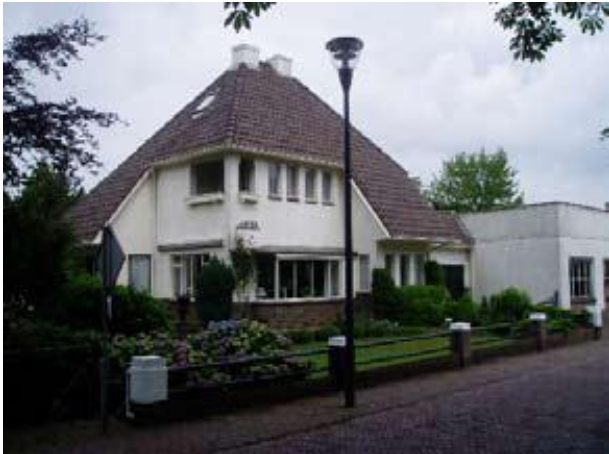
De Uiver, anno 2007