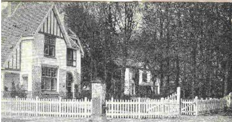
Haytinkhof en Den Oldenhof, 1907. Dorpspomp nog aanwezig.