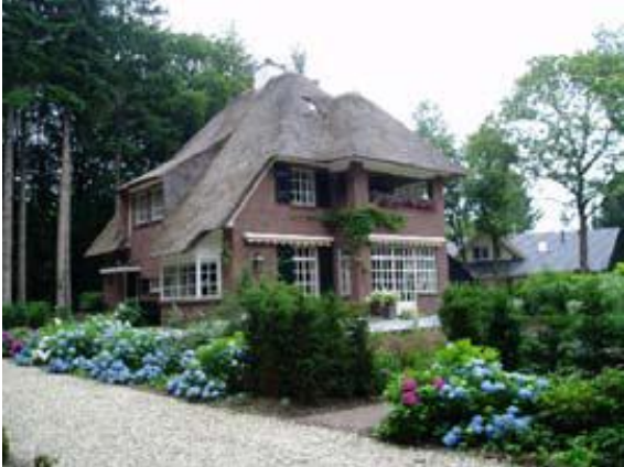
Foto: Joppelaan 76, anno 2007