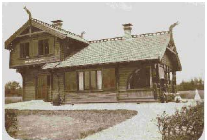
Het Noorsche huis, 1913