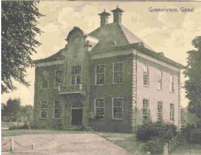
Voorzijde gemeentehuis, 1920

Tussen 1860 en 1914 stond het raadhuis van de gemeente Gorssel aan de Raadhuisstraat in Eefde. Dit was niet onomstreden. Bezwaarmakers uit het dorp Gorssel hebben tot de kroon geprocedeerd over de vestigingsplaats, maar krijgen te horen dat de beslissing tot de bevoegdheid van de gemeenteraad behoort.