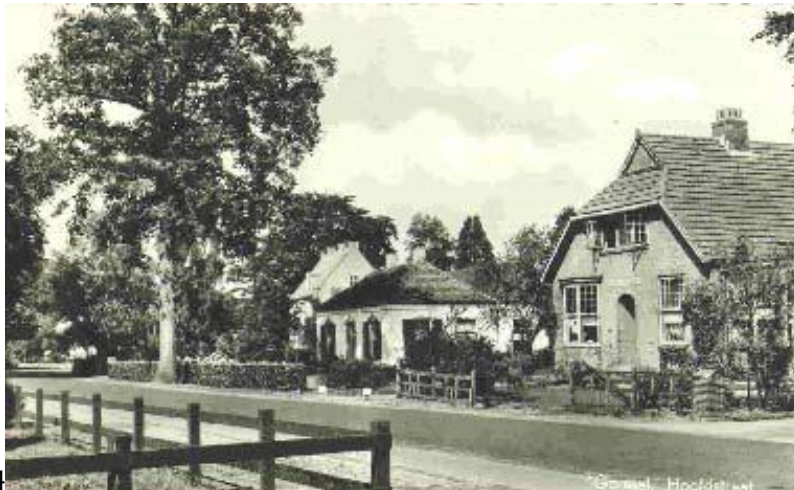
de Nijenhof 1964