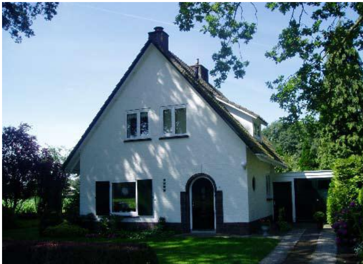
Foto: Nikkelsbergweg 2, anno 2007